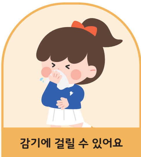
감기에 걸릴 수 있어요