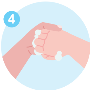
두 손 모아