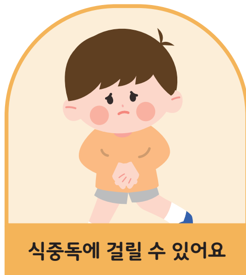
식중독에 걸릴 수 있어요

비누로 손을 씻으면 질병을 예방하고, 다른 사람에게 세균이나 바이러스가 퍼지는 것을 방지할 수 있어요!