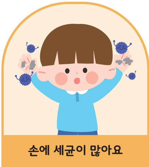
손에 세균이 많아요

깨끗해 보여도 손을 씻지 않으면 우리 손에 세균이나 바이러스가 남아 있을 수 있어요! 씻지 않은 손으로 눈, 코, 입을 만지는 경우 손에 남아있는 세균이나 바이러스가 우리 몸으로 들어가 우리를 아프게 할 수 있어요.