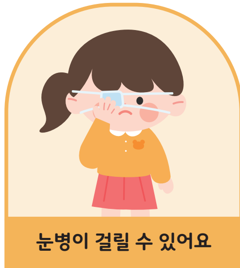
눈병이 걸릴 수 있어요