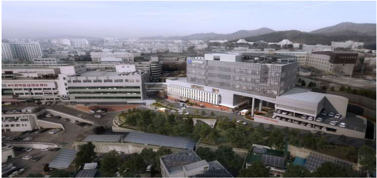
< 조감도 >