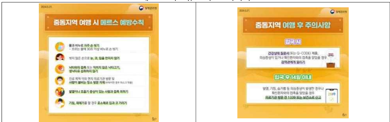
<메르스 카드뉴스 주요 이미지>

* ('21년) 6만 명 → ('22년) 90만 명 → ('23년) 180만 명 이상