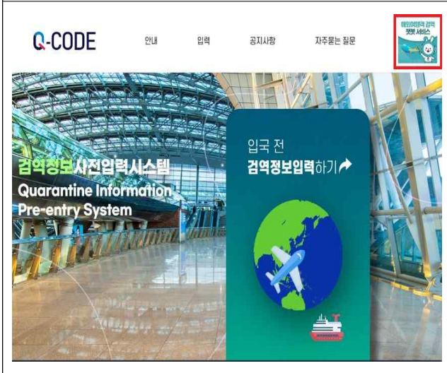
< 큐코드(Q-CODE) > (기존) cov19ent.kdca.go.kr / (신규) qcode.kdca.go.kr