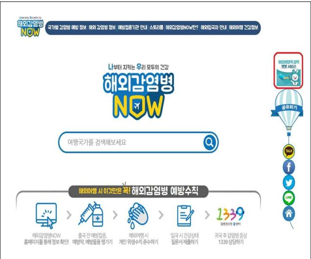
< 해외감염병NOW > 해외감염병now.kr